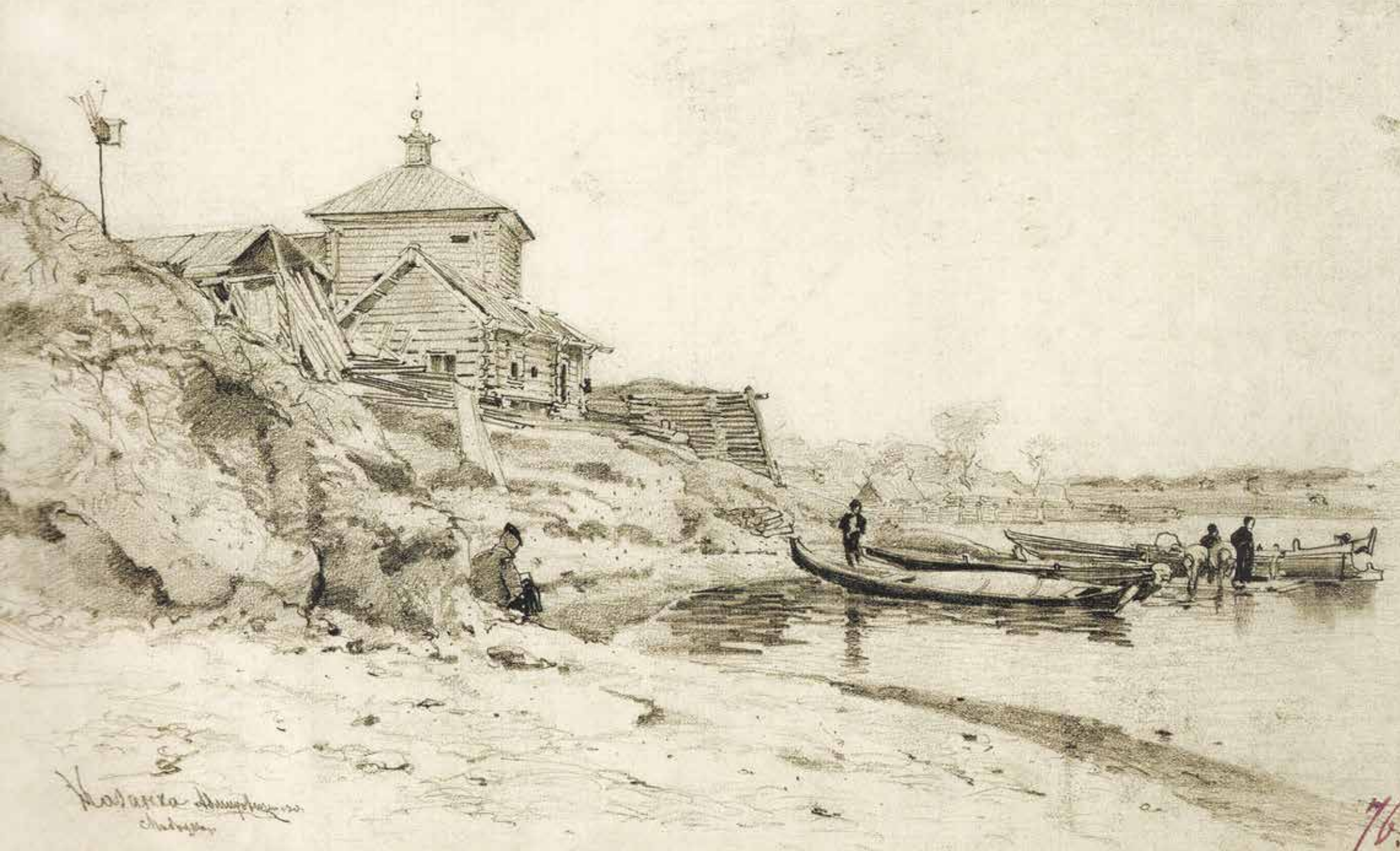
А. П. Боголюбов. Адмиралтейская слобода в Казани. 1861

До 1885 года медицинскую помощь населению оказывали один городской (правительственный) врач и фельдшер. Ни приёмных покоев, ни больниц не было.