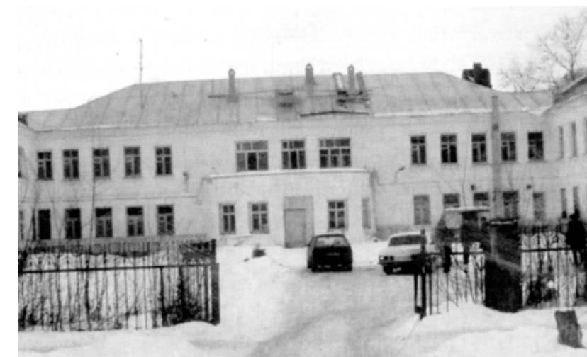
Адмиралтейская больница. Фотография из книги Я. Г. Павлухина, К. Ш. Зыятдинова «Очерки истории медицины Татарстана» (до 1917 года).

Фабрики и заводы, построенные в Адмиралтейской слободе на берегах Казанки, усугубляли и без того сложную экологическую ситуацию. Постоянный сброс в воду отходов производства и дым из труб делали слободу малопривлекательной