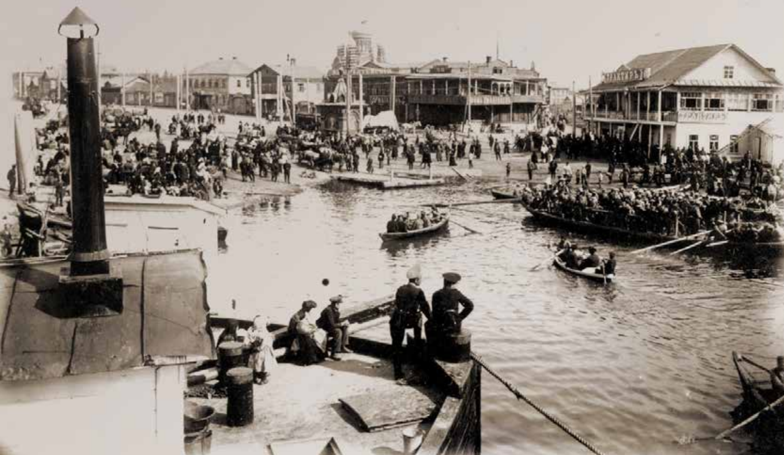
Казань. Конец XIX – начало XX веков.